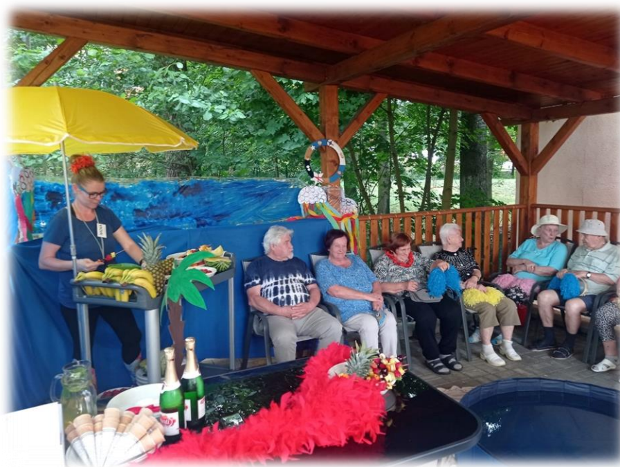
Dovolená – Cesta do Los MÚSSos