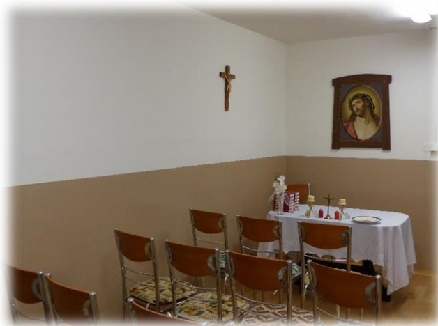
Kaple v přízemí Domova

V roce 2023 bychom chtěli navýšit personální obsazení o 2 pracovníky v sociálních službách a 1 sociální pracovníci.