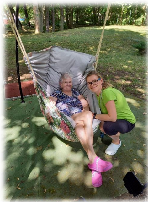
Nová „Houpajda“ pro klienty

V roce 2022 byl zaměstnán 1 pracovník v rámci Veřejně prospěšných prací. Na toto pracovní místo byl poskytnut příspěvek od Úřadu práce ve výši 15 000Kč .